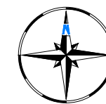
Wycinek planu orientacyjnego skala 1:10 000