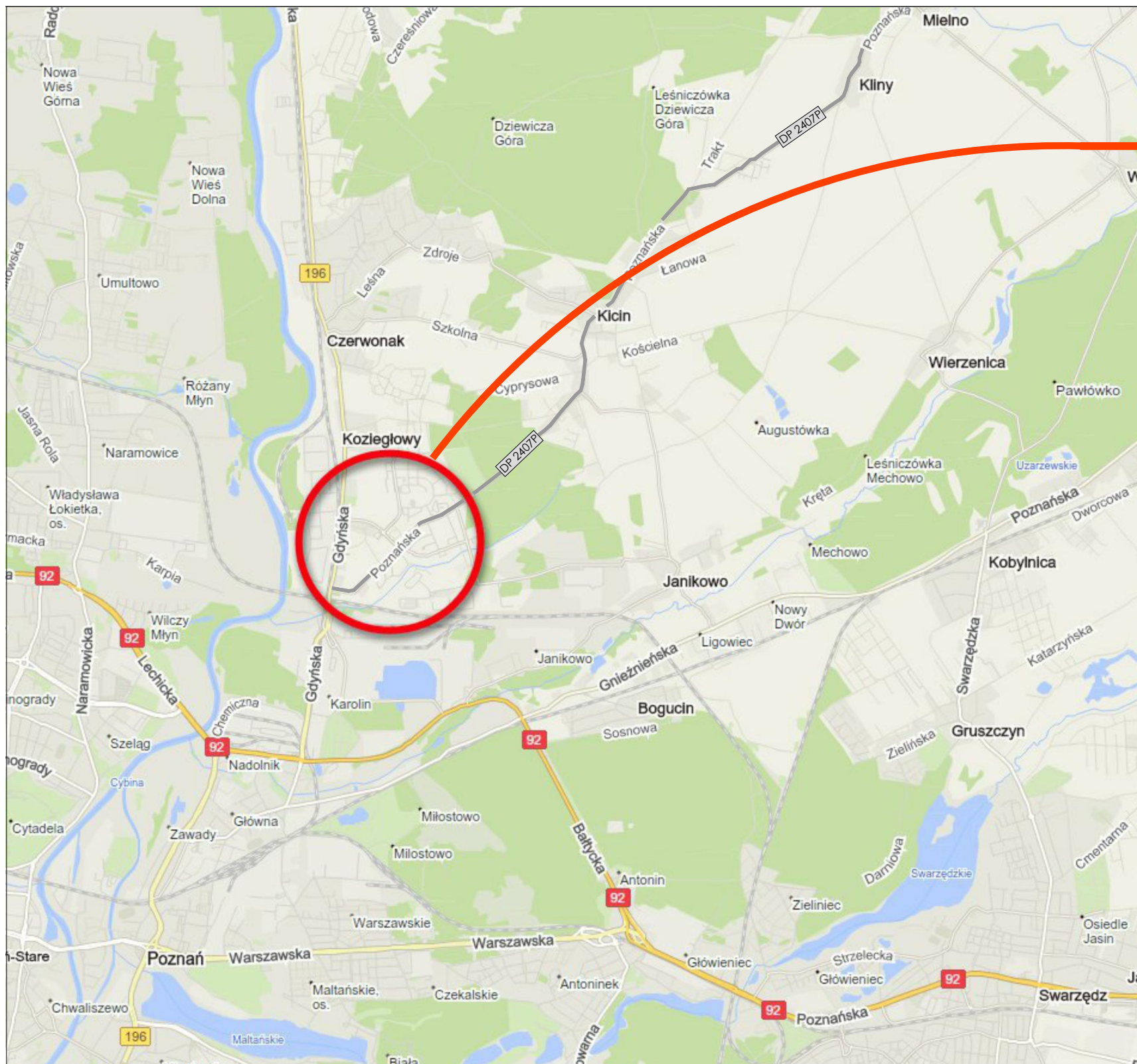
Plan orientacyjny skala 1:50 000